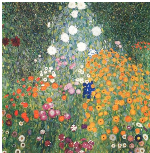
Κήπος με λουλούδια (1905) -