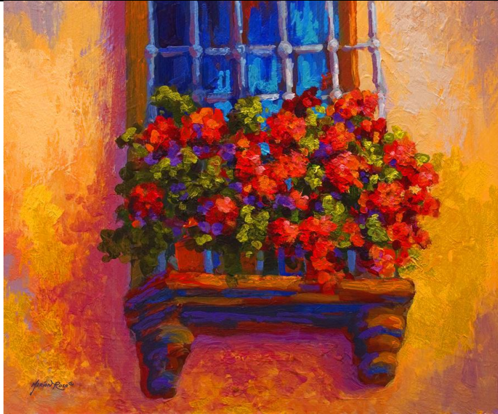
Λουλούδια στο μπαλκόνι -

Ας δούμε αρχικά κάποιους πίνακες γνωστών ζωγράφων με θέμα τα λουλούδια.